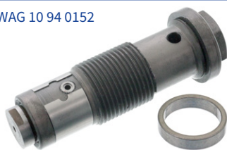
SWAG 10 94 0152

Если приспособление для измерения покажет значение больше, чем 75 (сплошная линия на шкале), то это признак того, что компоненты привода ГРМ изношены. В этом случае необходима дальнейшая проверка и замена соответствующих компонентов привода ГРМ.