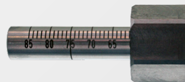
Приспособление для измерения SWAG 10 94 0125