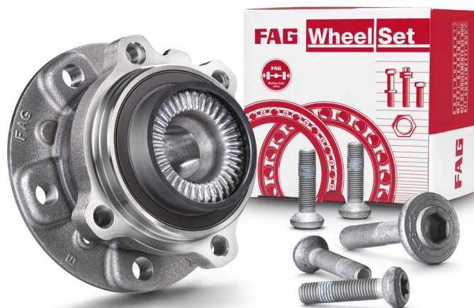
Рис. 2: Всегда используйте болты, поставляемые в ремонтном комплекте.

При конвейерной сборке автопроизводитель устанавливал однотипные ступичные узлы, но с разным шагом резьбы.