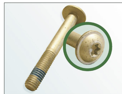
Рис. 3: LuK-AS болт

LuK-AS рекомендует заменять «оригинальный» болт (рис.2) своим болтом.