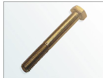
Рис. 2: "Оригинальный" болт

В соответствии с непрерывным развитием нашей продукции и гарантии качества, LuK-AS в данный момент поставляет новый болт (рис.3) с натяжным роликом 531 0274 30.