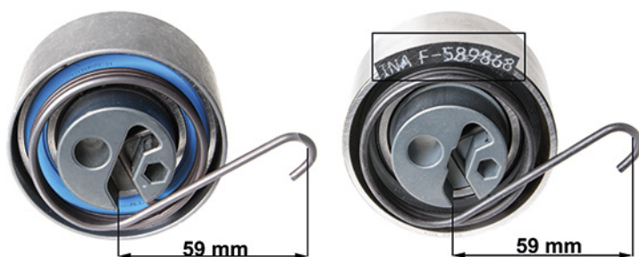
Рис. 2: 531 0819 10 – прежняя конструкция (слева), новая конструкция (справа)

Из-за схожести двух видов роликов натяжителя необходимо проявить особую внимательность при подборе правильной детали для соответствующего транспортного средства. Установка неверного натяжителя может привести к повреждению двигателя!