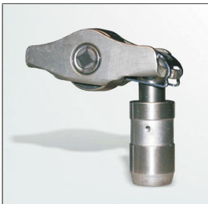
Рис 1: Конструкция 1

При замене коромысла и гидрокомпенсатора обратите внимание, что возможно применение двух вариантов конструкции (см. рис 1 и 2).