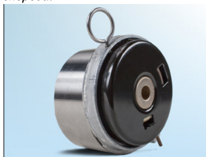
Рис. 3: Предыдущая модель; вид сзади.