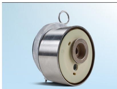
Рис. 1: Предыдущая модель; вид спереди.

Следуя постоянному развитию нашей продукции, конструкция натяжного ролика 531077910 была изменена. Этот лист показывает, какие визуальные отличия произошли между старой конструкцией и новой (см. рис 1-4). Допустимо смешение конструкций в поставках во время переходной фазы производства.