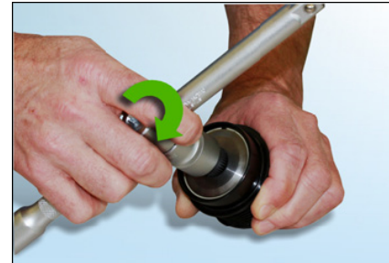
Рис. 6: Вы должны помнить о возвращающей пружинной силе при проворачивании инструмента против часовой стрелки.

Соблюдайте рекомендации автопроизводителя!