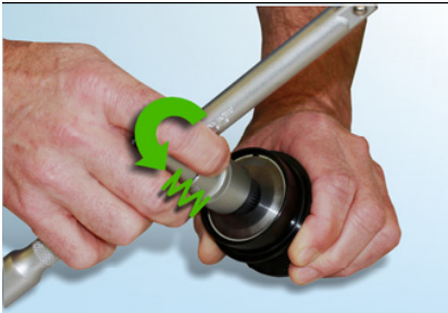
Рис. 6: Вы должны помнить о возвращающей пружинной силе при проворачивании инструмента против часовой стрелки.