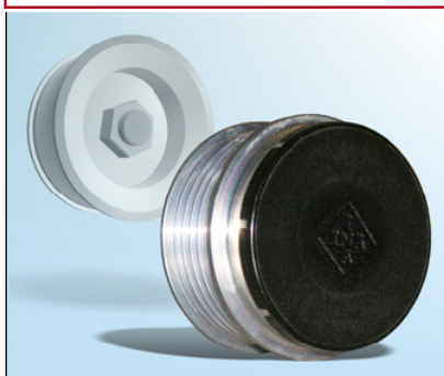
Рис. 2: Защитная крышка должна быть установлена на шкивы OAP и OAD для защиты от грязи

Замечание: Проверить установленный шкив иногда непросто. Поэтому рекомендуется снять его перед началом диагностики.