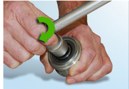
Рис. 5: Инструмент должен проворачиваться по часовой стрелке с легким сопротивлением.