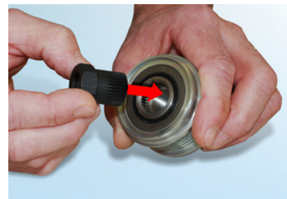
Рис. 3: Соответствующий адаптер вставляется в шкив с обгонной муфтой

Инструкция по диагностике: Подходящий адаптер должен быть выбран из набора специнструмента при снятии или диагностике шкивов OAP / OAD