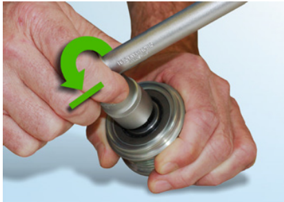
Рис. 4: Инструмент должен надежно блокироваться при провороте его против часовой стрелки.