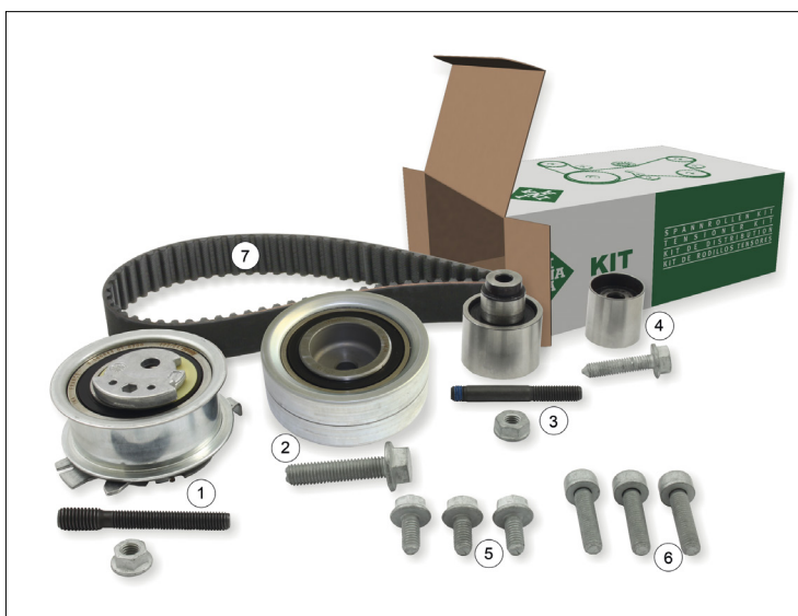
Рисунок 1: Ремонтный комплект натяжных роликов INA KIT 530 0550 10

Все компоненты ременного привода ГРМ разрабатываются таким образом, чтобы достичь одинакового ресурса и подвергаться одинаковому износу.