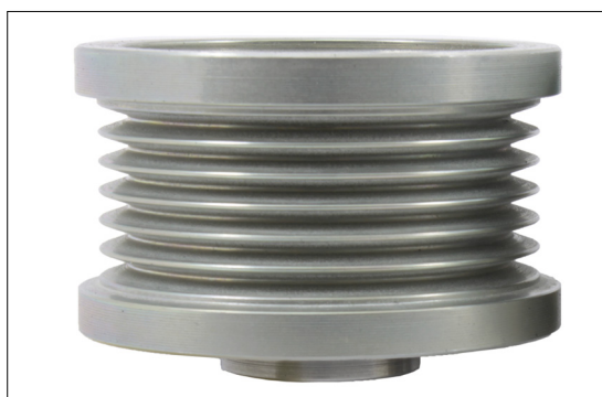
Рисунок 2: Шкив генератора с обгонной муфтой с 6 канавками, артикульный номер 535 0202 10

Данный шкив генератора также может без проблем применяться на генераторах с ременной передачей, имеющей 5 клиньев.