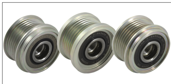
Рисунок 2: Шкив генератора с обгонной муфтой 535 0063 10 (слева), 535 0202 10 (центр), 535 0203 10 (справа).

В указанных автомобилях, оборудованных жестким шкивом генератора, могут возникать вибрации и сильные шумы в системе натяжения ремня привода навесных агрегатов. Данные вибрации и шумы вызваны неравномерностью вращения дизельного двигателя, которая больше, чем в бензиновом двигателе.