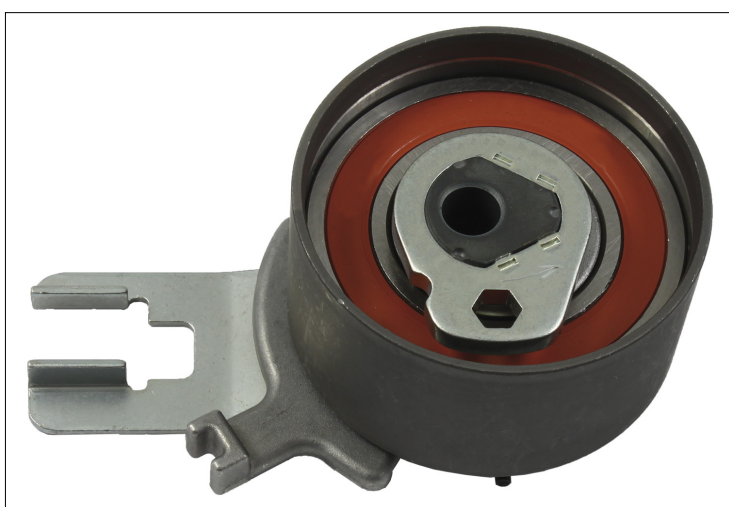
Рисунок 1: Новый натяжной ролик 531 0859 10

В указанных автомобилях, натяжной ролик 531 0515 10 (рис. 2) может использоваться в некоторых вариантах двигателей.