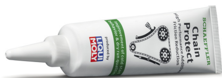
Рис. 1: Schaeffler Chain Protect разрабатывалась специально для использования только во время установки новых деталей цепного привода ГРМ. Присадка доступна только в комплектах цепного привода INA KIT.

Емкость присадки рассчитана на полное ее использование во время установки. Присадка наносится на все элементы – приводную цепь, все звезды и направляющие. В дальнейшем присадка смешивается с моторным маслом и сохраняется в нем до следующей замены.