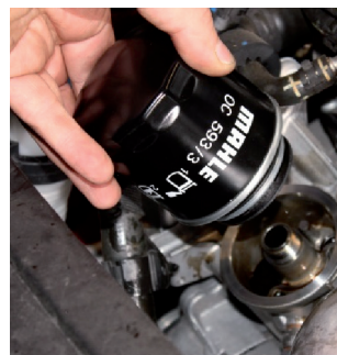
Εικόνα 3: Λασκάροντας το παλιό φίλτρο, προσέξτε ώστε να μην εισχωρήσει λάδι κινητήρα στην κίνηση ιμάντα ή στη γεννήτρια.