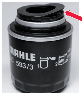
Εικόνα 2: Η επάνω φλάντζα (ανασηκωμένη προς διευκρίνιση) αναλαμβάνει το κλείσιμο του μηχανισμού ρελαντί στη φλάντζα