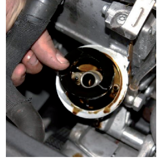
Resim 4: Eski conta flanşın içerisinde yapışmış olarak kalabilir ve mutlaka çıkarılması gerekir.

ÖNEMLİ! Yeni filtreyi monte etmeden önce, eski contanın kalıp kalmadığı mutlaka kontrol edilmeli ve gerekirse bu conta el ile flanştan çıkarılmalıdır. Ayrıca, montajdan önce yeni conta bileziklerine daima temiz motor yağı sürülmesi de önemlidir.