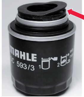
Resim 2: Üstteki conta (anlaşılır hale getirmek için kaldırılmıştır), flanş içerisindeki rölanti mekaniğinin kapatılmasını üstlenir.