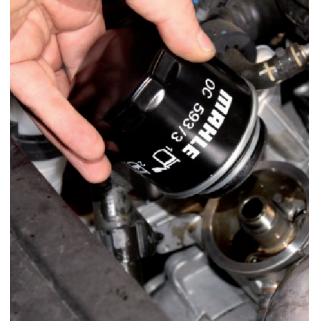
Resim 3: Eski filtreyi sökerken, motor yağının kayışlı tahrike veya alternatöre ulaşmamasına dikkat edilmelidir.