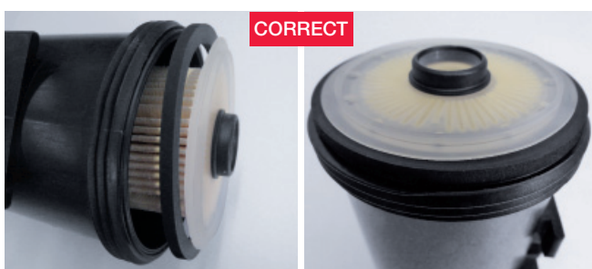
Illustration 2: ordre de montage correct