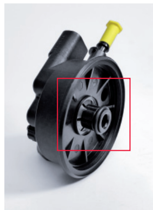
Illustration 3: joint correctement positionné