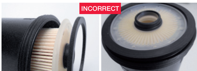
Illustration 1: ordre de montage incorrect

Notre conseil : à chaque remplacement de filtre, vérifiez que le joint torique est placé correctement !