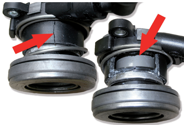
Рисунок 5: CSC поврежден в результате неправильной установки