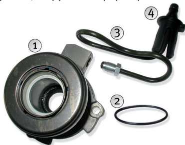
Рисунок 1: Снимите и утилизируйте все компоненты

Рисунок 1: Удалите следующие детали и убедитесь, что они выбраны верно: Изношенный CSC (1), уплотнение на фланце корпуса трансмиссии (2), соединительную трубку (3) и пластиковую муфту (4) используемую для фиксации трубки в корпусе трансмиссии.