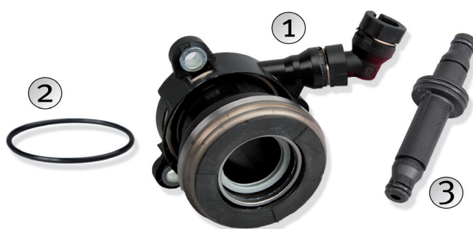
Рисунок 2: LuK CSC 510 0073 10 актуальная конструкция

Alfa Romeo: 159 Fiat: Croma (194) Opel: Astra G, Astra H, Combo, Corsa C, Corsa D, Meriva, Signum, Tigra, Vectra B, Vectra C, Zafira Saab: 9-3 Vauxhall: Astra Mk IV, Astra Mk V, Combo, Corsa Mk II, Meriva, Tigra, Vectra, Vectra Mk II, Zafira, Zafira Mk II