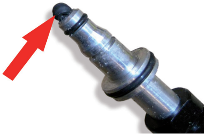
Рисунок 4: Если старое уплотнение не снять, то его вдавливают в новый CSC и блокирует трубку.

Система должна быть заполнена при замене CSC. Заполнение систем жидкостью состоит из двух отдельных процессов: заполнение системы выключения сцепления и промывка CSC.