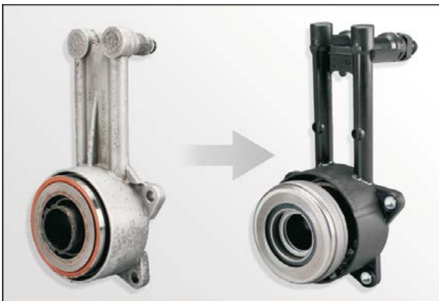
Рис. 1: Металлический корпус гидравлического выжимного подшипника заменен на пластиковый

Несмотря на различия в конструкции, оба гидравлических выжимных подшипника могут быть использованы в автомобилях, указанных в каталогах.