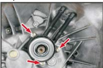
Рис. 7: Монтаж подшипника новой конструкции

Используя ступенчатое или коническое сверло, расточите отверстия по крайней мере до 21 мм, максимально до 24 мм. После растачивания удалите заусенцы по краям отверстий и тщательно очистите корпус от загрязнений.