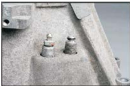
Рис. 3: Демонтаж подшипника старой конструкции