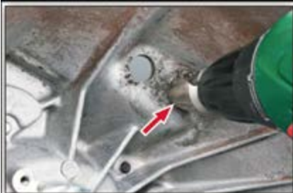
Рис. 5: Растачивание отверстий

Произведите демонтаж гидравлического выжимного подшипника старой конструкции (металлический корпус) и измерьте диаметр отверстий. Если отверстия меньше 21 мм в диаметре, то их необходимо расточить.