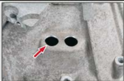
Рис. 6: Зачистка отверстий

Используя ступенчатое или коническое сверло, расточите отверстия по крайней мере до 21 мм, максимально до 24 мм. После растачивания удалите заусенцы по краям отверстий и тщательно очистите корпус от загрязнений.