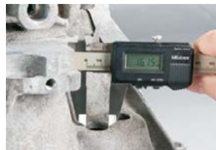
Рис 2: Если диаметр отверстий меньше 21 мм, то он должен быть увеличен по крайней мере до 21мм, максимум до 24мм.

Если диаметр отверстия меньше 21 мм, то его необходимо расточить минимум до 21 мм, максимум 24 мм. На странице 2 приведена пошаговая инструкция (Рис. 3 по 8) процесса растачивания отверстий.