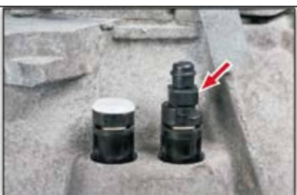
Рис. 8: Спускной патрубок можно подключить вручную или при помощи гаечного ключа (13 мм)

Подсоедините гидравлический подшипник новой конструкции к корпусу и затяните с усилием 10 (+1) Нм. При отключенном сцеплении (после установки КПП) спускной патрубок легко открывается и закрывается при повороте на 180° вручную или гаечным ключом (13 мм).