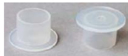
Рис. 2: Уплотнительная пробка

Для того, чтобы предотвратить вытекание масла из КПП и мехатроники, каждый комплект маховика LuK DMF и сцепления LuK RepSet@2CT имеют две уплотнительные пробки. Эти пробки должны быть установлены до того, как КПП будет демонтирована; они устанавливаются на место черных вентиляционных колпачков, показанных на рис 1. После того, как ремонт завершен, пробки необходимо заменить обратно колпачками.